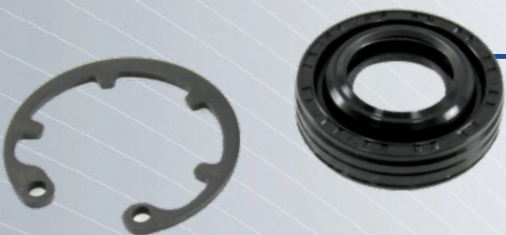
SELLOS T/ MODELOS