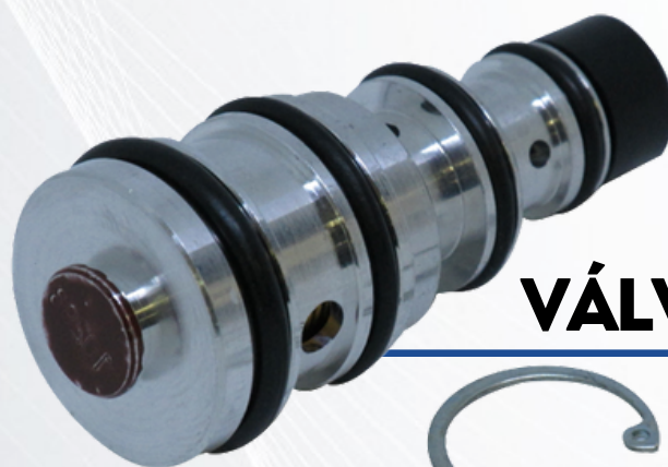
VÁLVULA DE CONTROL